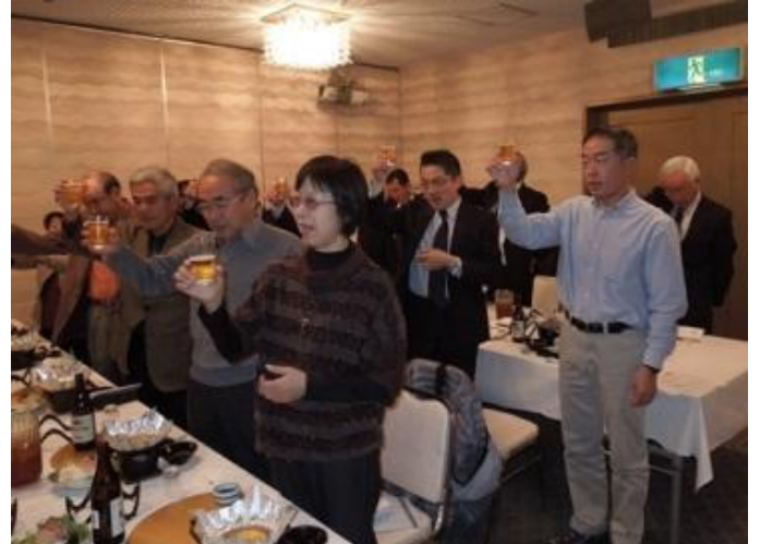
ビールで乾杯し開宴