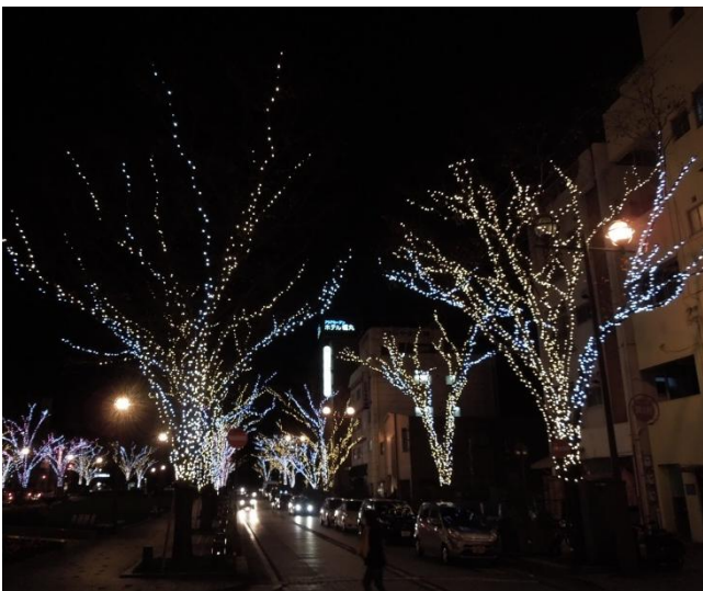
忘年会後、外に出るとホテルの前はイルミネーションが美しく輝く