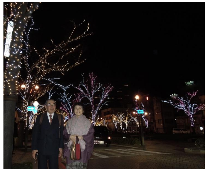
丸野夫婦がイルミネーションをバックに写真撮影