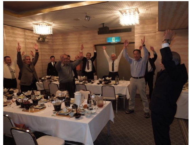
名残を惜しみつつ万歳三唱でお開きに