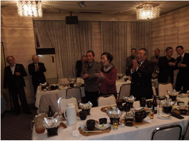
学生時代を思い出しながら逍遙歌を熱唱