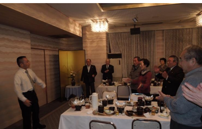
久保のリードで道遙歌の斉唱